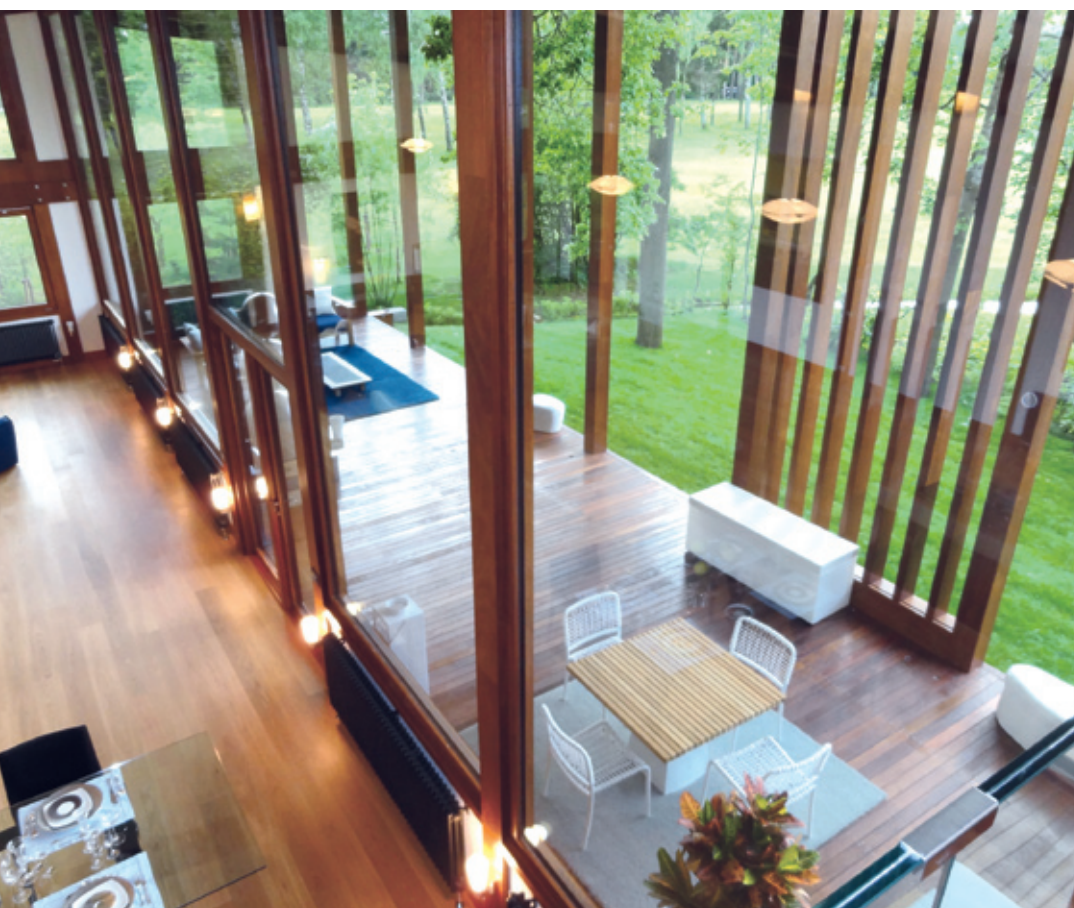
A sinistra, la zona anteriore sviluppa tutta una zona esterna coperta arredata con divani e lettini a formare un naturale passaggio tra interno ed esterno.

a controllo numerico e alle maestranze altamente qualificate la casa è stata prodotta sia negli elementi portanti che nei dettagli di finitura. La struttura poi, una volta prodotta, è stata trasportata in cantiere e montata in tempi rapidi che sfidano e superano anche i limiti del rigido clima dell'inverno moscovita.