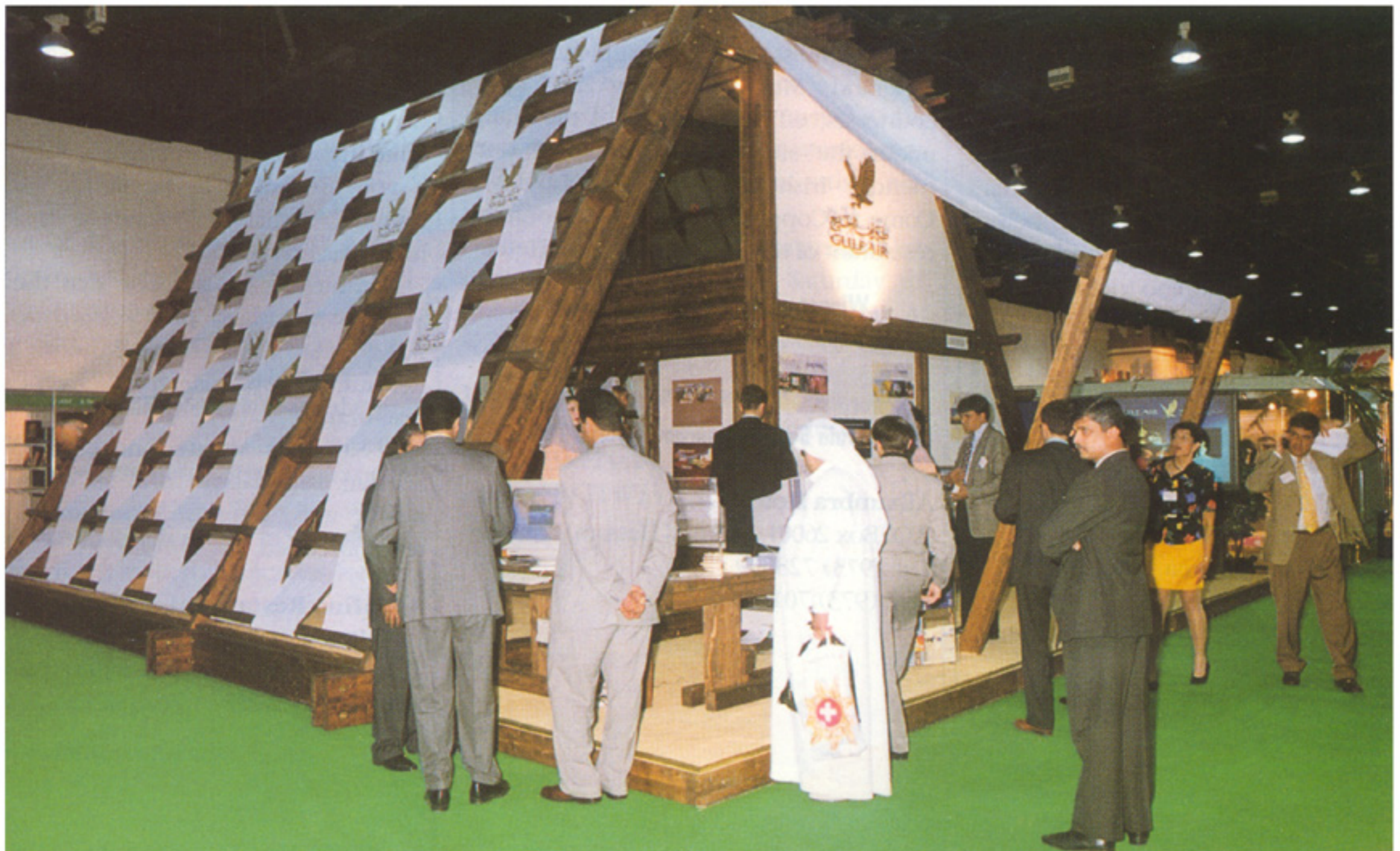
Gulf Air's stand at the Arabian Travel Market held in Dubai's World Trade Centre.