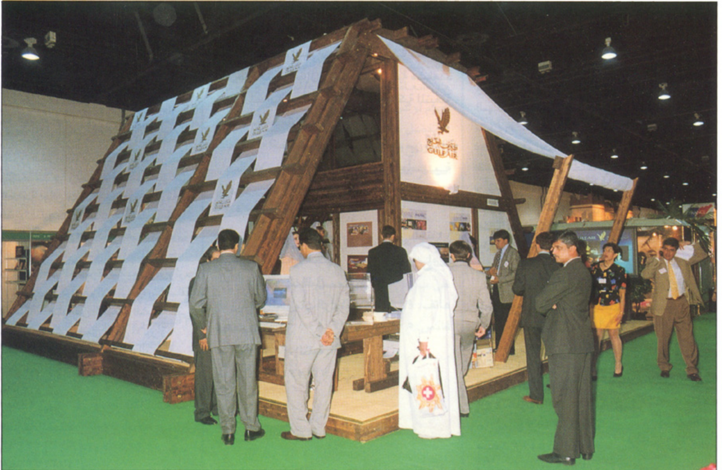
جناح طيران الخليج في معرض سوق السفر العربية الذي أقيم في المركز التجاري الدولي في دبي .

وقد تفضل سمو الفريق الشيخ محمد بن راشد آل مكتوم ولي عهد إمارة دبي ووزير الدفاع بدولة الإمارات العربية المتحدة بافتتاح السوق الذي استمر يومين . وترأس سعادة الشيخ أحمد بن سيف آل نهيان الرئيس التنفيذي لطيران الخليج وفد طيران الخليج الى سوق السفر العربي . وقد ضم الوفد عدداً من كبار المسؤولين بالشركة . ومرة أخرى قدمت طيران الخليج ابتكاراً تجسد في جناحها المصمم على هيئة خيمة تقليدية عربية . وقد حاز الجناح على اعجاب الزوار واعتبر